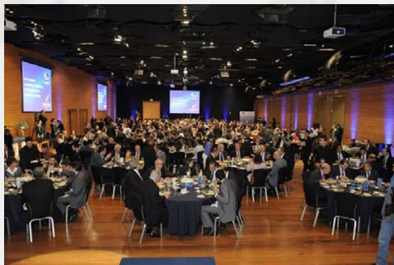
Convidados participam do evento que celebrou a listagem de 100 empresas no Novo Mercado.